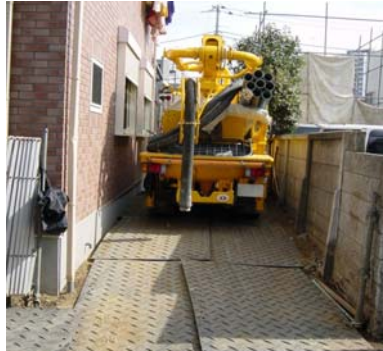
25tクレーン車が通過!