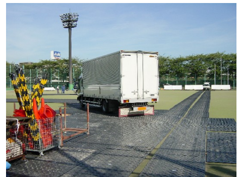
仮設駐車場(工事現場)